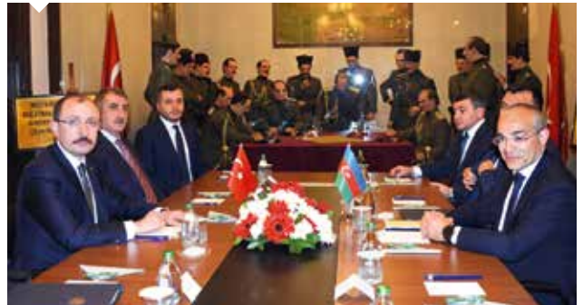
Türkiye-Azerbaycan Tercihli Ticaret Anlaşması'nın imza töreni Samsun'daki Gazi Müzesi'nde gerçekleştirildi.

Türkiye'nin Azerbaycan'a yönelik ihracatında makineler ve mekanik cihazlar ve yedek parçaları, demir ve çelikten eşyalar, elektrikli makine ve cihazlar ve yedek parçaları, mobilya, otomotiv, optik alet ve cihazlar, mineral yakıtlar önemli pay alıyor. Bunun yanı sıra Türkiye'nin tuz, kükürt, taş, alçı ve çimento, kâğıt, karton ve maddeleri, sabun ve müstahzarlarında ihracat potansiyeli bulunuyor.