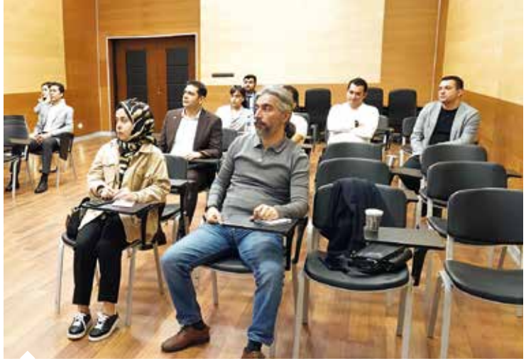
AKİB e-İhracat Projesi'ne, 100'ün üzerinde başvuru arasından 10 firma kabul edildi.