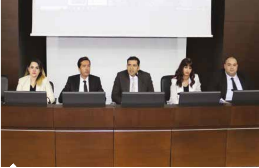
AKİB'de görevli uzmanlar, Adanalı sanayicilerin yeni nesil devlet desteklerinden nasıl yararlanacaklarını anlattı.

merkezi Mersin'de olan AKİB'in Adana, Antakya, İskenderun, Kayseri ve Karaman'daki irtibat bürolarıyla bölgedeki firmaların ihracat maratonunda kolaylaştırıcı rol oynadığını vurguladı.