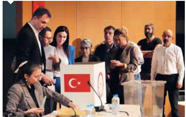
AHKİB üyeleri, AKİB hizmet binasında kurulan sandıkta oy kullandı.