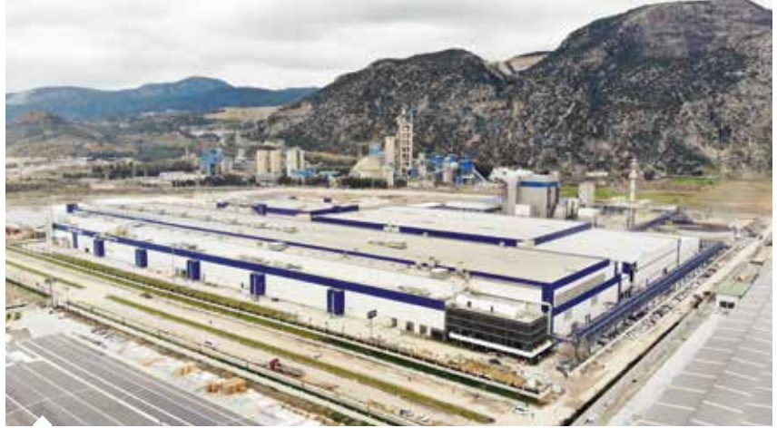
1984'te Öksüz ve Gümüşer ailelerinin öncülüğünde kurulan Kipaş Holding, tekstil, çimento, kâğıt, eğitim, enerji ve lojistik başta olmak üzere birçok sektörde Türkiye ekonomisine güç veriyor.

Kipaş Holding, daha önce bünyesindeki Kipaş Kâğıt İşletmeleri üzerinden Aydın'ın Söke ilçesinde 550 milyon dolarlık yatırımla Batı Kipaş Kâğıt Fabrikasını ül-