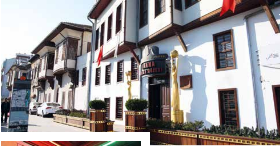
Adana Sinema Müzesi, merkez Seyhan ilçesi Kayalıbağ Mahallesi'ndeki Seyhan Caddesi üzerinde bulunuyor.

Adana'nın Seyhan ilçesinde bulunan Sinema Müzesi, ziyaretçilerini Yeşilçam tarihinde yolculuğa çıkarıyor. Müzeye dönüştürülen Tepebağ konağında Türk sinemasına damga vuran Adanalı oyuncuların, yönetmenlerin ve sinemaya ilham veren yazarların anıları yaşatılıyor.